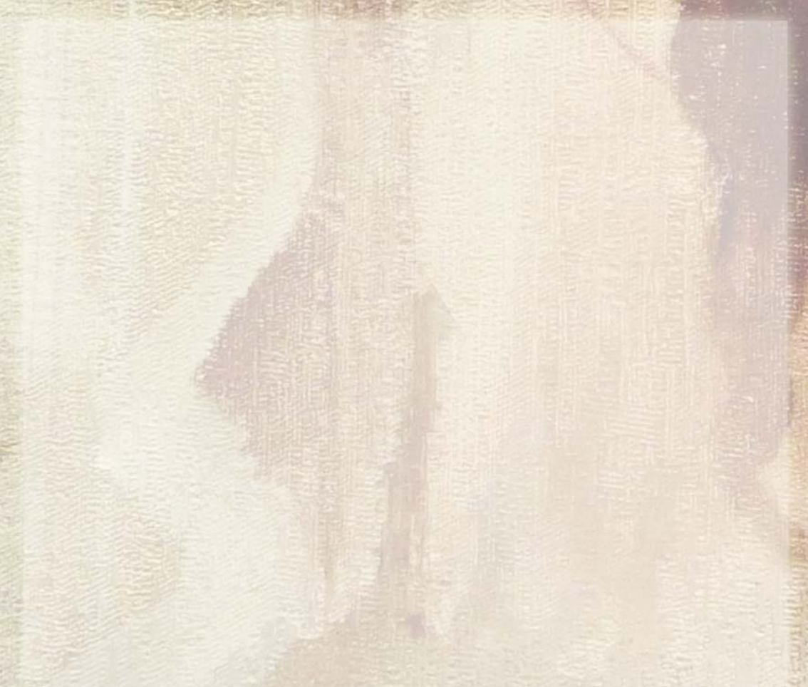
La collection d'icônes « Apothéose », Divna Cvejic Paris, 2016.